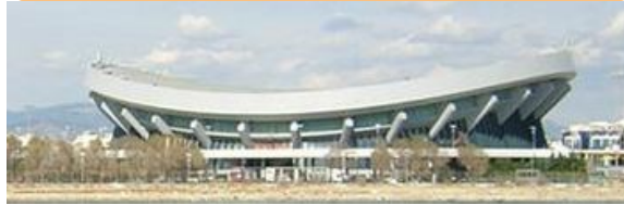
Στάδιο Ειρήνης & Φιλίας