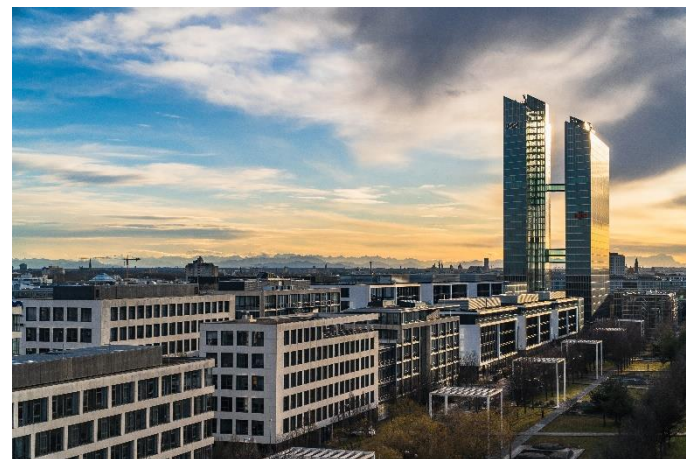
«Hochhaus»

Σύμφωνα με την Κρατική Στατιστική Υπηρεσία της Βαυαρίας, το απόθεμα κατοικιών/διαμερισμάτων σε κτίρια οικιστικής και μη οικιστικής χρήσης στη Βαυαρία ανέρχεται σε μόλις 6,67 εκατομμύρια κατοικίες στις 31 Δεκεμβρίου 2022. Το ποσοστό αυτό αντιστοιχεί σε αύξηση 61.265 κατοικιών δηλ. ποσοστό 0,9 % έναντι του αποθέματος κατοικιών στα τέλη του 2021. Σε επίπεδο διοικητικών περιφερειών το χαμηλότερο ποσοστό αύξησης διαθεσίμων κατοικιών καταγράφεται στην Άνω Φραγκονία με 0,5 %, ενώ η Κάτω Βαυαρία παρουσιάζει την υψηλότερη σχετική μεταβολή με 1,2 %. Στα τέλη του 2022 το απόθεμα κατοικιών στη Βαυαρία περιλαμβάνει 946.759 κατοικίες που διαθέτουν ένα ή δύο δωμάτια. Αυτό αντιστοιχεί σε ποσοστό 14,2 % του συνόλου των κατοικιών και σε αύξηση 18.276 κατοικιών ή 2,0 % σε σχέση με τον Δεκέμβριο του 2021. Η ποσοστιαία αύξηση του αποθέματος των κατοικιών που διαθέτουν ένα ή δύο δωμάτια είναι επομένως σημαντικά υψηλότερη από την αύξηση του συνολικού αποθέματος κατοικιών που ανέρχεται σε 0,9 %.