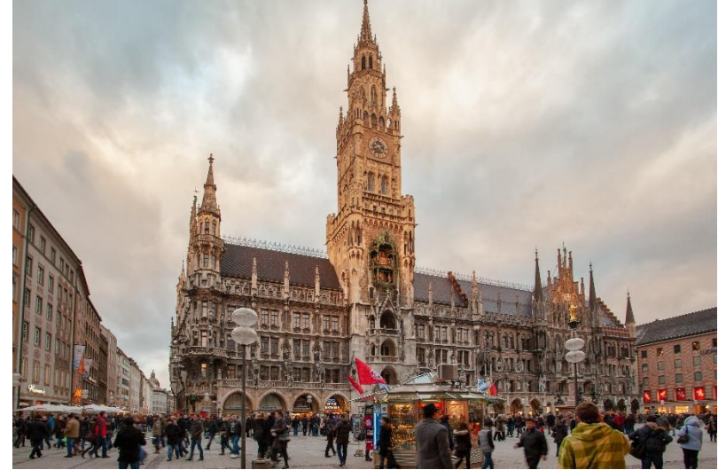
«Stadtzentrum» του Sergey Mind δημοσιεύτηκε με την άδεια CC0 στις 4.4.2020.

Η χρήση των ετικετών ΠΟΠ και ΠΓΕ της ΕΕ – εκπαιδευτικά σούπερ μάρκετ όπως το Lidl και το Aldi, για παράδειγμα, προσφέρουν περιστασιακά προϊόντα με προστατευόμενες γεωγραφικές ενδείξεις – δεν είναι ακόμη αρκετά διαδεδομένη και δεν αποτελεί καθοριστικό ρόλο για τους καταναλωτές ως προς την επιλογή των προϊόντων και την αγοραστική τους απόφαση.