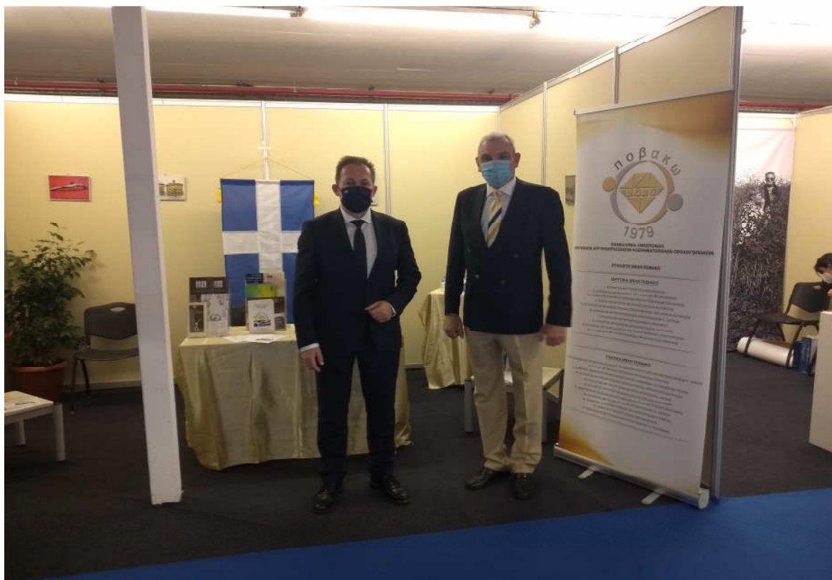
Το stand της ΠΟΒΑΚΩ επισκέφτηκε ο αναπληρωτής υπουργός Εσωτερικών, Στέλιος Πέτσας. Στη φωτογραφία με τον πρόεδρο της ΠΟΒΑΚΩ, Πέτρο Καλπακίδη